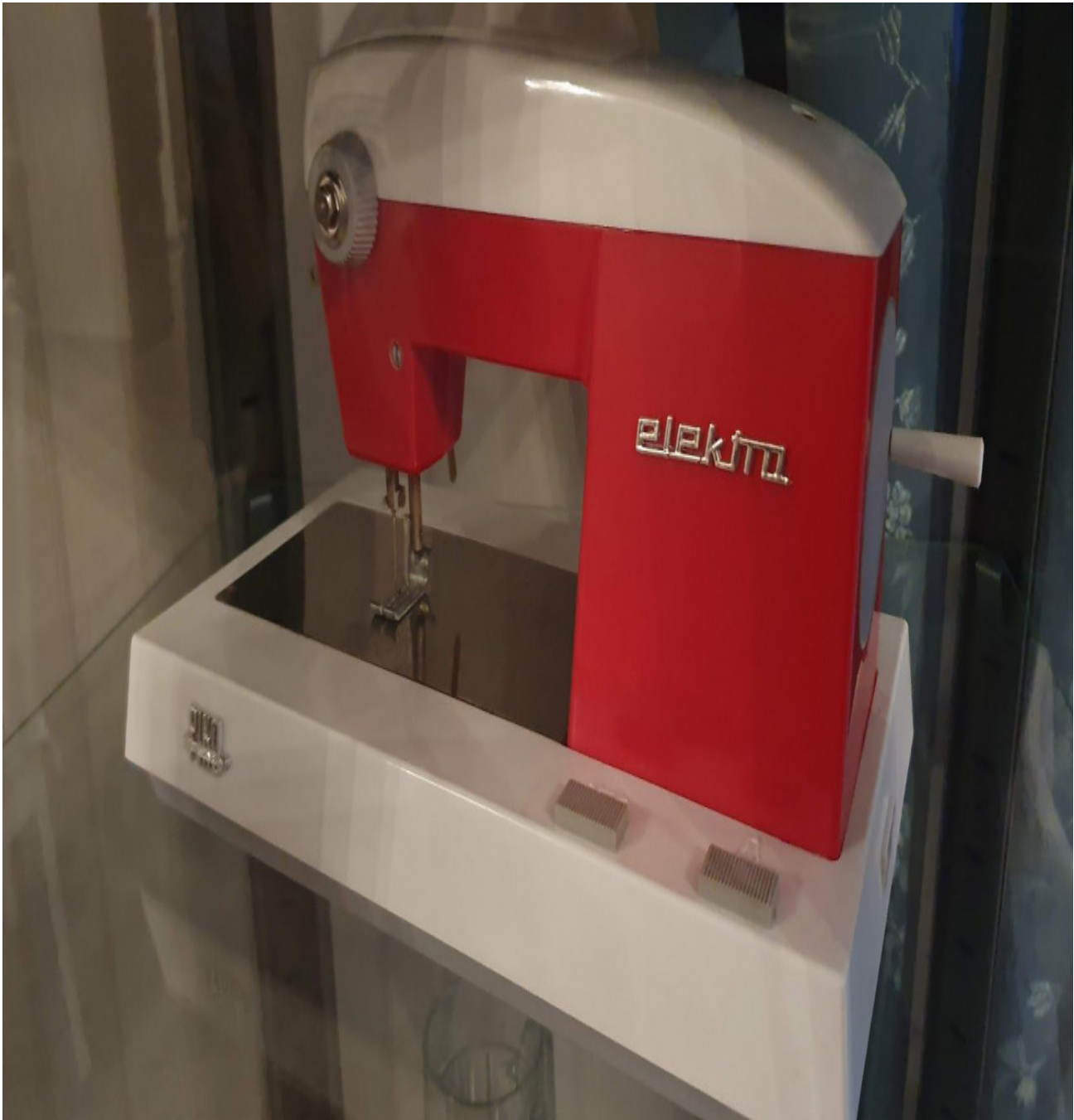
Kindernähmaschine PICO Elektra

Die PICO Elektra ist eine Kindernähmaschine.