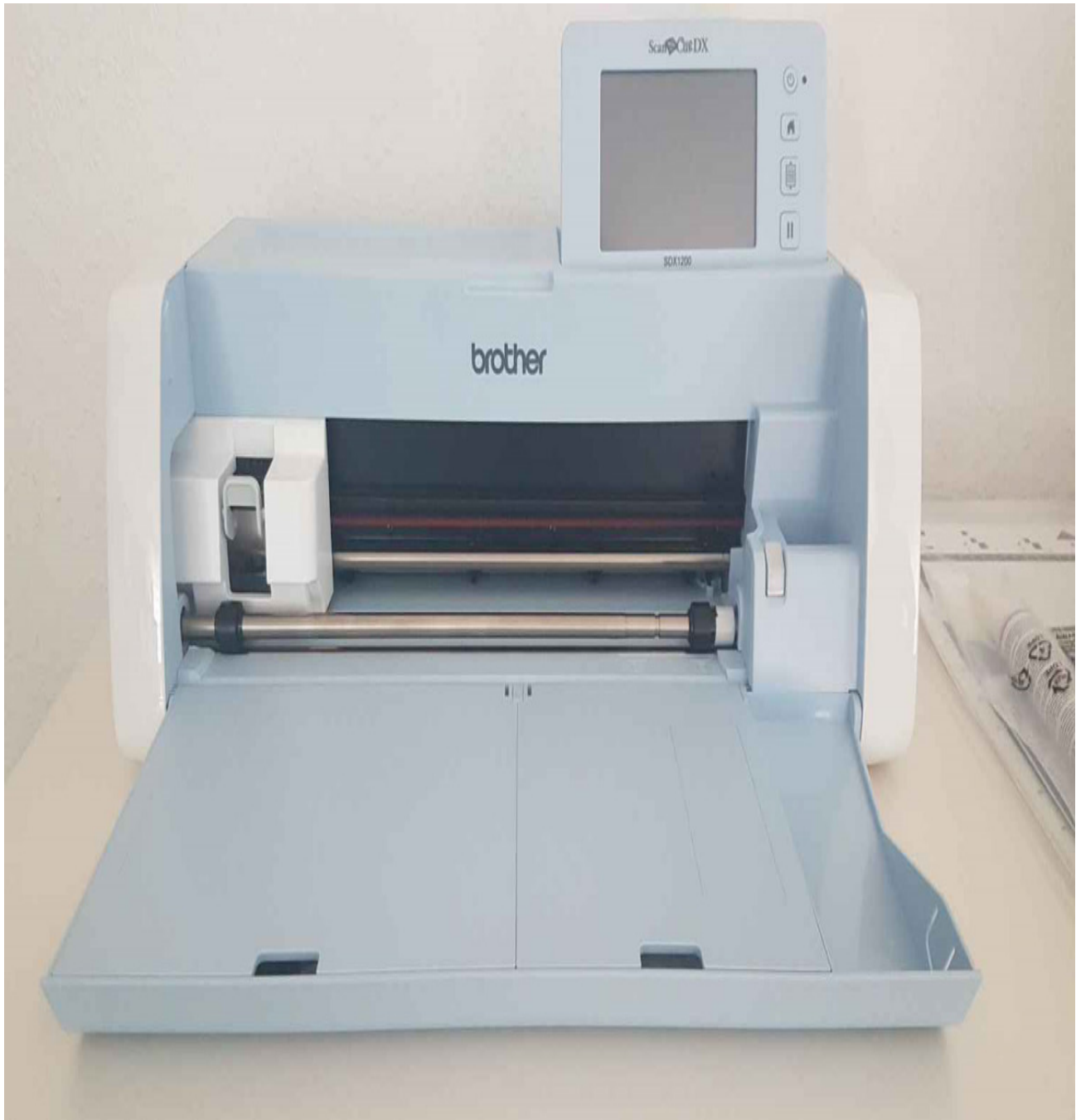
brother ScanNCut SDX1200

Der brother ScanNCut SDX1200 erhielt den iF Design Award 2019.