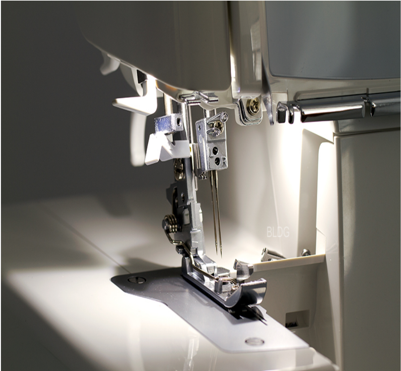
LED-Beleuchtung des Arbeitsfeldes

LED-Beleuchtung: Das LED-Licht leuchtet den Nähbereich so gut aus, dass Sie zu jeder Tageszeit ohne Sichtprobleme mit Ihrer MO-2000 arbeiten können.