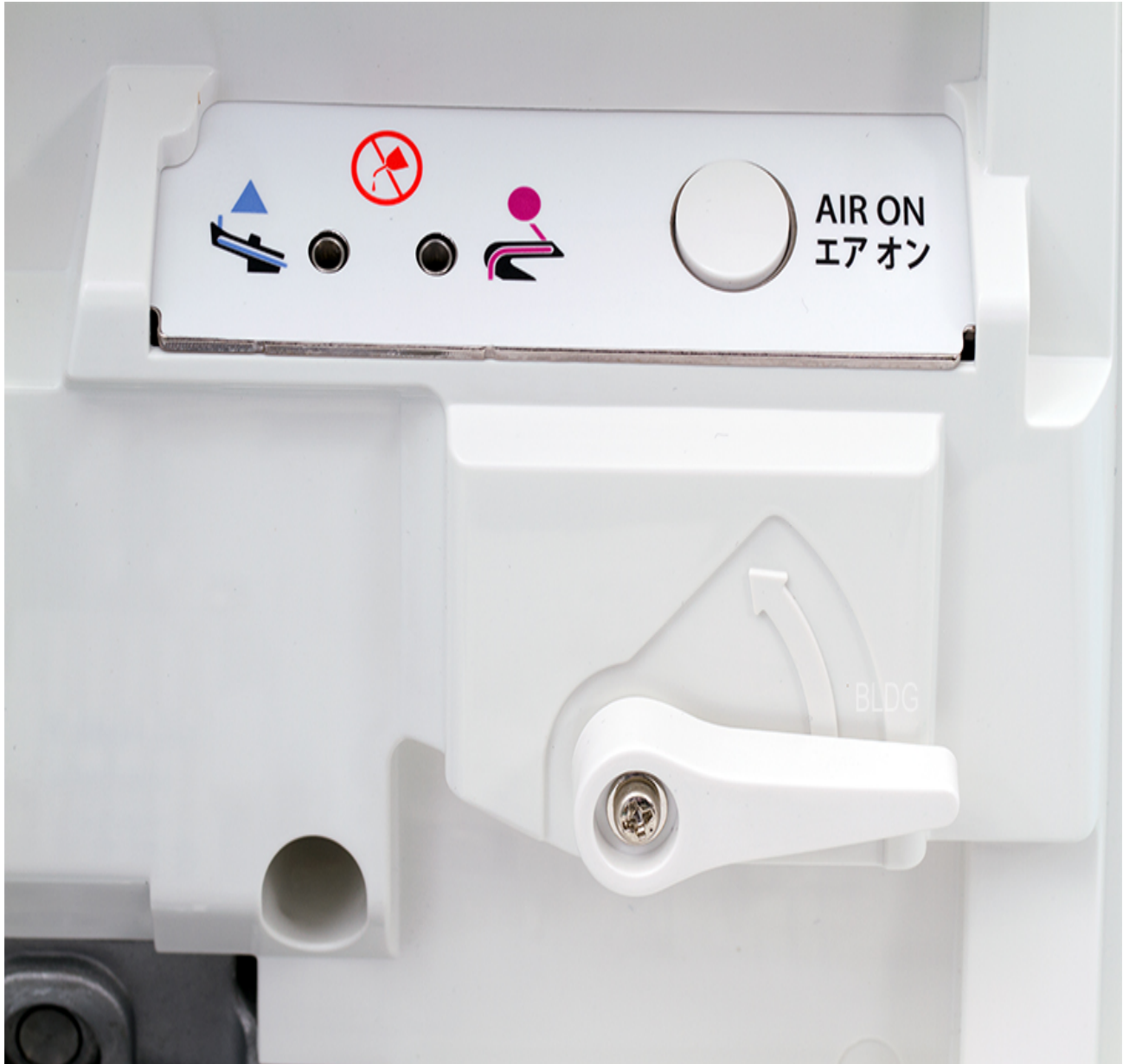
Easy Threading System

Easy-Threading-System: Das geniale Easy Threading System von JUKI: mit der Kraft der Luft werden Ober- und Untergreifer eingefädelt. Einfach den gewünschten Greiferfaden in die Einfädelöffnung führen und per Knopfdruck schießt der Faden durch die Greiferkanäle und kommt direkt an der Greiferspitze heraus.