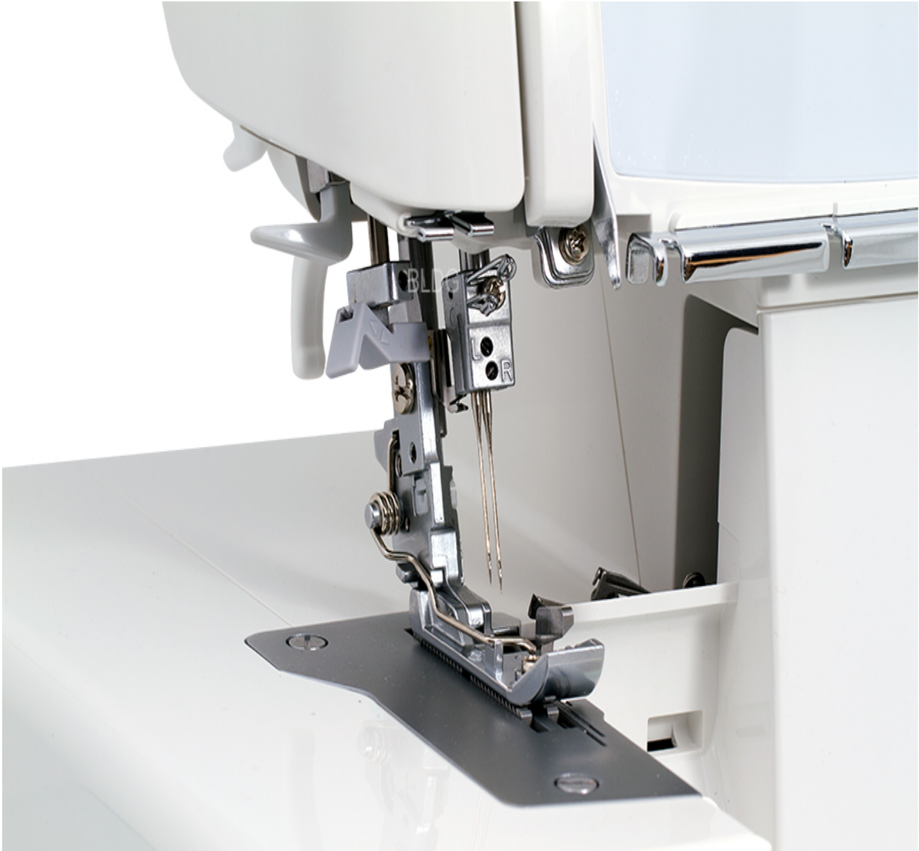
Abstand Gehäuse - Stichplatte

Abstand Gehäuse - Stichplatte : Mehr Freiheit beim Nähen mit der JUKI MO-2000. Mit einem Freiraum von 72,4 mm zwischen Gehäuse und Stichplatte haben Sie für Ihre Nähprojekte viel Platz.